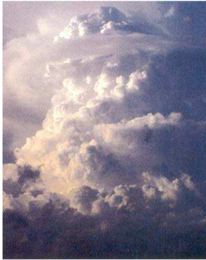
Figure 11 Cumulonimbus

Brotak, E., Wild About Weather, A Division of Sterling Publishing Co., Inc. (p. 89)