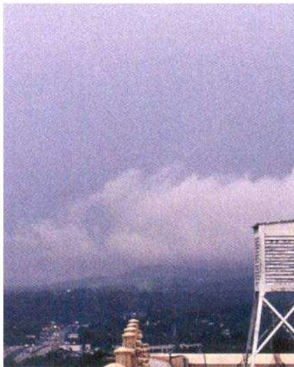
Figure 8 Nimbostratus

Nimbostratus. Ceux-ci apparaissent comme des couches gris foncé de gros nuages, gonflés. Quand ils produisent de la précipitation, elle est en forme de pluie ou de neige constante. La partie inférieure de ce nuage est souvent cachée par la pluie ou la neige qui tombe, qui peut être abondante.