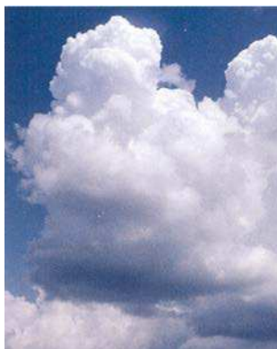
Figure 10 Cumulus bourgeonnants

Cumulus bourgeonnant. Ces nuages s'accumulent en de hautes masses bourgeonnantes. Ils ont des parties supérieures blanches, gonflées mais des parties inférieures très foncées. Les nuages cumulus bourgeonnants peuvent produire des averses et peuvent se transformer en glace dense ou en orages.