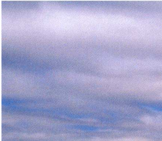
Figure 7 Stratocumulus

Brotak, E., Wild About Weather, A Division of Sterling Publishing Co., Inc. (p. 87)