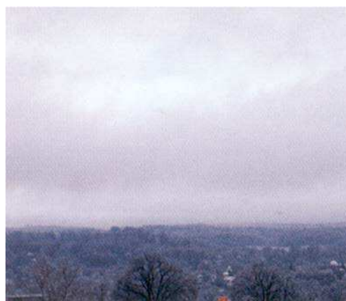
Figure 6 Stratus

Stratus. Ces nuages se présentent en feuilles basses, ennuyeuses, grisâtres qui couvrent complètement le ciel (semblables à du brouillard). Pendant la journée, on ne peut pas voir le soleil. Ils peuvent produire de la bruine ou de la pluie très légère ou de la neige. Quand il y a des nuages profonds au-dessus, la pluie ou la neige peut être plus abondante.