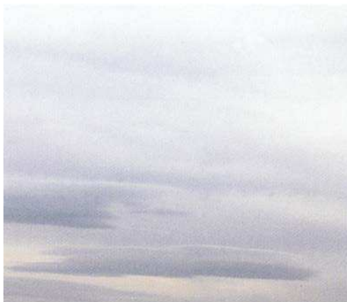
Figure 5 Altostratus

Brotak, E., Wild About Weather, A Division of Sterling Publishing Co., Inc. (p. 87)