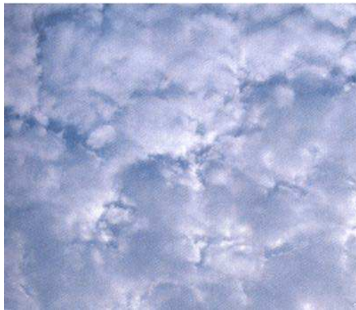
Figure 4 Altocumulus

Altocumulus. Ces nuages sont très gros et peuvent être blancs ou gris. Ils se présentent comme une couche ou une série de bancs de masses rondes. On peut voir les nuages altocumulus avant du beau ou du mauvais temps, et ils ont peu de valeur comme indicateur de conditions climatiques futures.