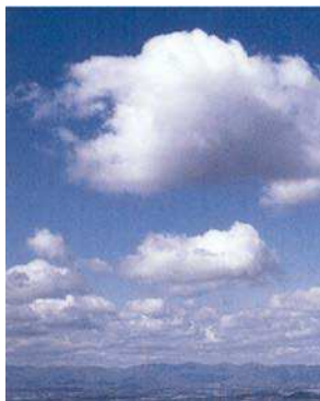
Figure 9 Cumulus

chaude. Quand ces nuages sont dans le ciel, on peut prévoir du beau temps, à moins qu'ils commencent à s'étendre vers le haut.