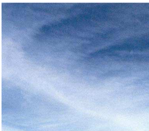
Figure 2 Cirrostratus

Cirrostratus. Ces nuages sont des feuilles blanchâtres qui couvrent complètement le ciel. Les nuages cirrostratus sont généralement transparents. Quand ces nuages sont dans le ciel, on peut s'attendre à des précipitations dans un ou deux jours.