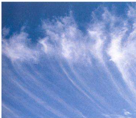
Figure 1 Cirrus

Cirrus. Ces nuages se forment en traînées et ressemblent à de la barbe à papa qu'on étire. Ils ressemblent à des traînées de nuage blanchâtres et sont habituellement un indicateur de beau temps.