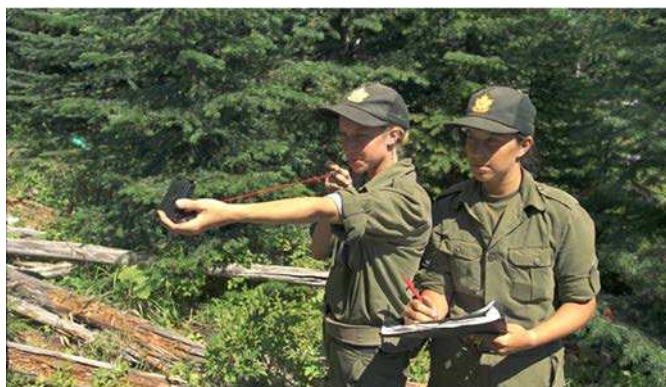
Figure 1 Déterminer un azimut magnétique

Nota : On peut demander à des instructeurs adjoints de surveiller la performance des cadets.