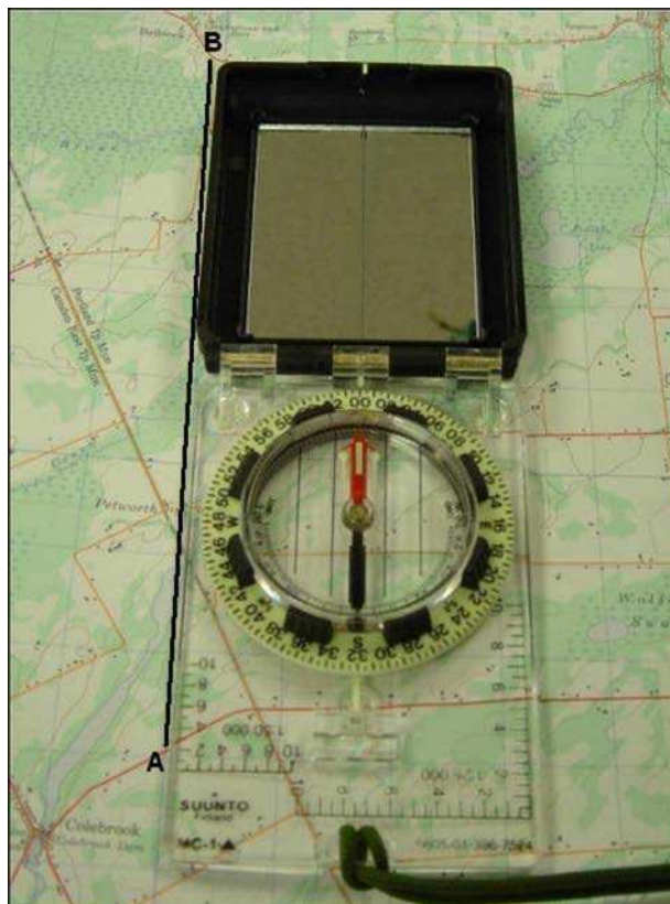
Figure 2 Mesurer un azimuth magnétique sur une carte D Cad 3, 2007, Ottawa ON, Ministère de la Défense nationale

Pour mesurer un azimuth magnétique sur une carte :