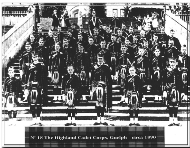
Figure 1 Corps de cadets de 1890

La distinction entre les cadets d'école secondaire et les miliciens adultes est devenue évidente en 1879 lorsque l'Ordre général de la milice 18 autorisait la formation de 74 « associations d'exercice militaire dans les institutions d'enseignement » pour les jeunes hommes âgés de plus de 14 ans qui ne devaient « sous aucun prétexte être employés dans le service actif ». Les cadets fournissaient leurs propres uniformes. Les cadets, dans la photo ci-dessous, ont importé leurs uniformes de l'Écosse à des coûts si élevés que seulement un jeune par famille pouvait faire partie du mouvement.