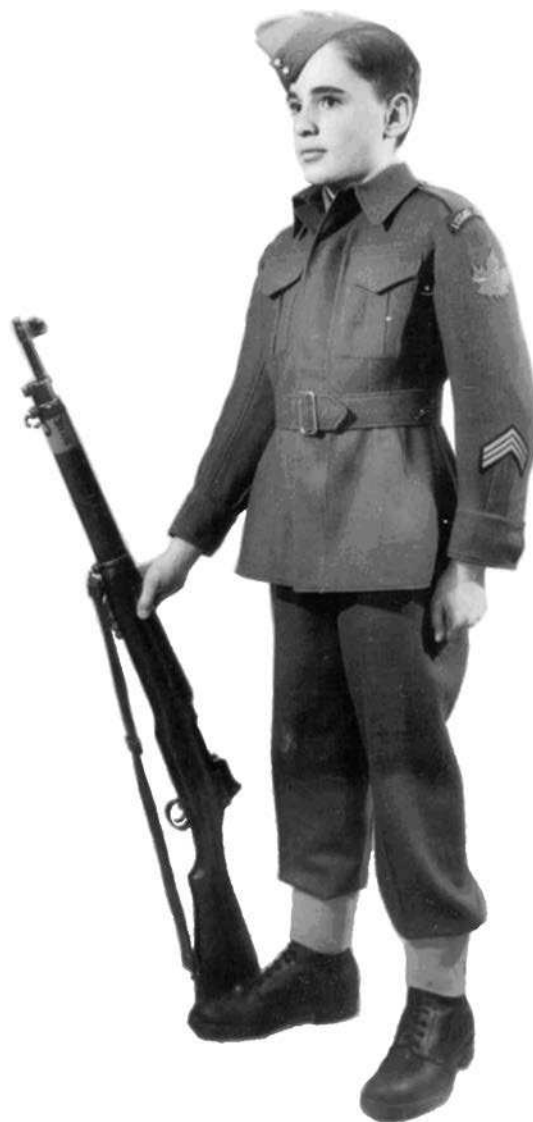
Figure 6 Modèle de l'uniforme en 1942

Ligue des cadets de l'Armée du Canada. 2007. Comité de l'histoire et de l'héritage, Attributs, Insignes d'épaule, Insignes de coiffure et Uniformes. Extrait le 23 avril 2007 du site http://www.armycadethistory.com/Uniforms.htm