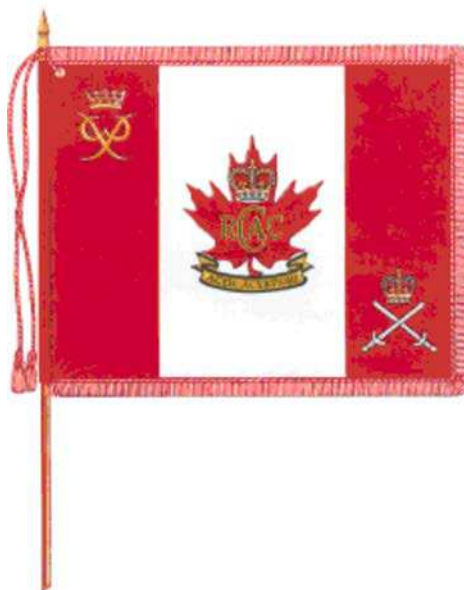
Figure 8 La bannière des Cadets royaux de l'Armée canadienne

Ministère de la Défense nationale. 2007. Symbols of the Royal Canadian Army Cadets . Extrait le 16 avril 2007 du site http://www.cadets.ca/armcad/resources-ressources/symbols/army_flags/army_flags.htm