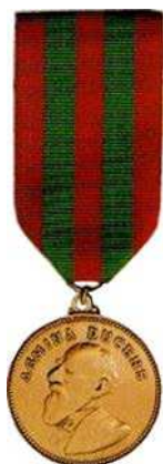
Figure 4 La médaille Lord Strathcona