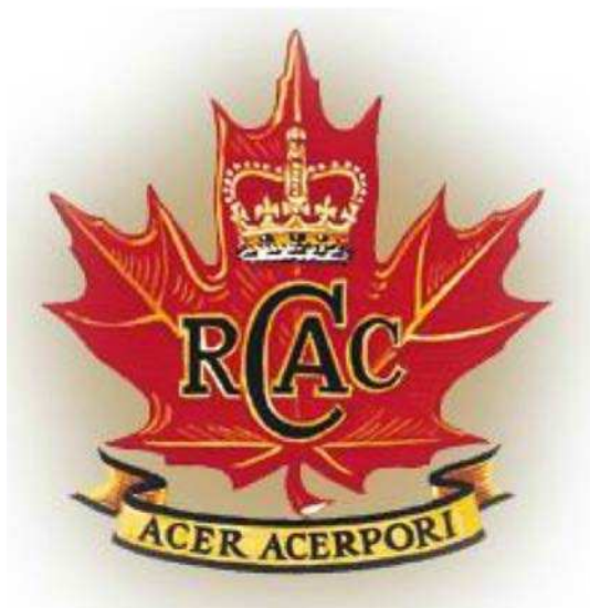
Figure 5 L'écusson des cadets royaux de l'Armée canadienne

Ligue des cadets de l'Armée du Canada. 2007. Comité de l'histoire et l'héritage, Histoire des cadets de l'Armée. Extrait le 16 avril 2007 du site http://www.armycadethistory.com/Main_page.htm