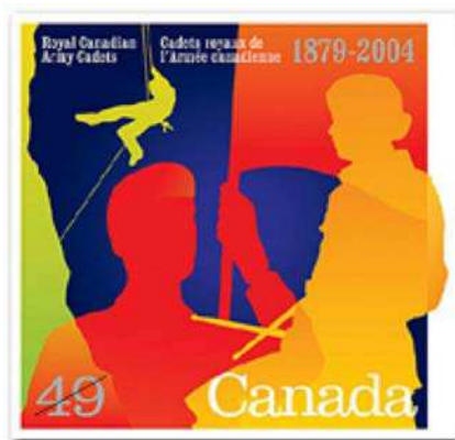
Figure 11 Le timbre des cadets de l'Armée émis par Postes Canada

L'année 2004 a marqué le 125 e anniversaire des Cadets royaux de l'Armée canadienne. Postes Canada a honoré les cadets de l'Armée en émettant un timbre commémoratif, qui a été présenté à Ottawa le 26 mars 2004.