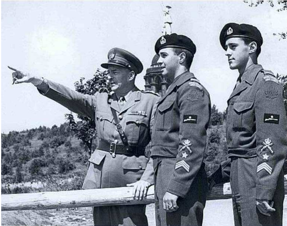
Figure 7 Modèle de l'uniforme en 1950

Ligue des cadets de l'Armée du Canada. 2007. Comité de l'histoire et de l'héritage, Attributs, Insignes d'épaule, Insignes de coiffure et Uniformes. Extrait le 23 avril 2007 du site http://www.armycadethistory.com/Uniforms.htm