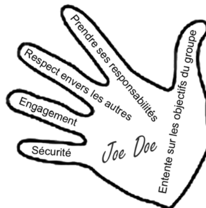
Figure B-2 Le contrat à cinq doigts

Chaque cadet signe sur sa main et la colle sur un carton ou sur un tableau de papier. L'ensemble des mains du groupe représente l'engagement mutuel de chacun d'eux.