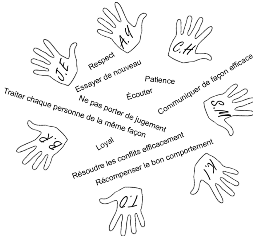
Figure B-4 La chaîne de mains

D Cad 3, 2007, Ottawa, ON, Ministère de la Défense nationale